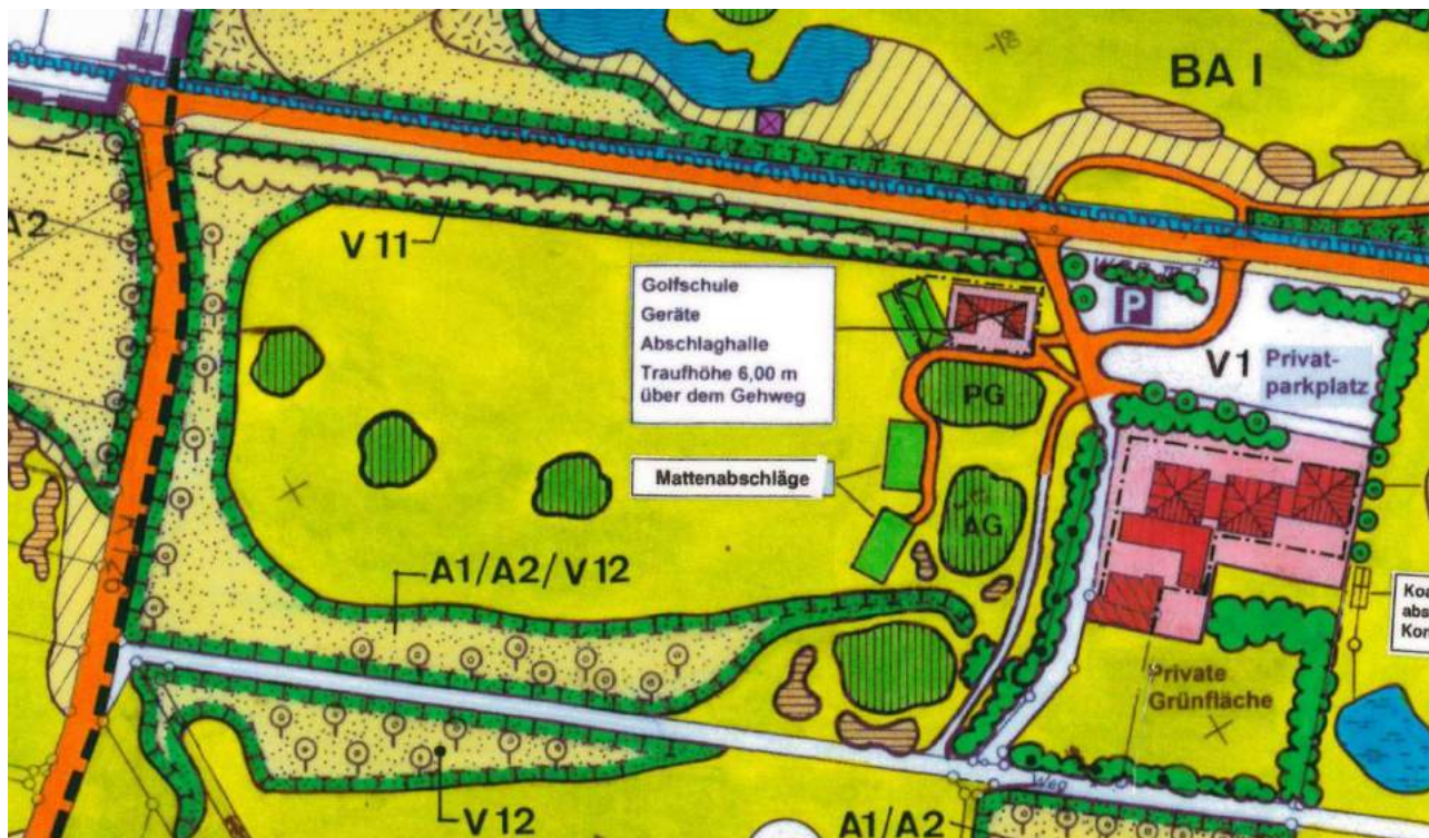
Abbildung 4: Derzeitige planungsrechtliche Regelungen (Quelle: Ausschnitt Bebauungsplan „Golfplatz Burbach“, Teilbereich | ohne Maßstab)

Um die neue Planung zu verwirklichen, wird eine Konkretisierung der überbaubaren Grundstücksflächen sowie deren Erweiterung und neue Definition nach BauNVO notwendig. Durch die geplante Bebauungsplanänderung soll die bereits in Ursprungsbebauungsplan geregelte Flächennutzung angepasst werden. Die allgemeine Zweckbestimmung des bestehenden Sondergebiets „Golfplatz“ wird durch die zu erfolgende Planänderung in Teilen aufgehoben und neu definiert. Der Hauptnutzungszweck des Sonstigen Sondergebiets „Golfplatz Burbach“ wird durch die Anpassung eines kleinen Teilgebiets nicht verändert. Die Grundkonzeption des Bebauungsplans „Golfplatz Burbach“ sowie die Regelungen des Ausgleichs (Ausgleichskonzept) bleiben erhalten. Für die neuen Planflächen wird das Ausgleichskonzept neu erarbeitet.