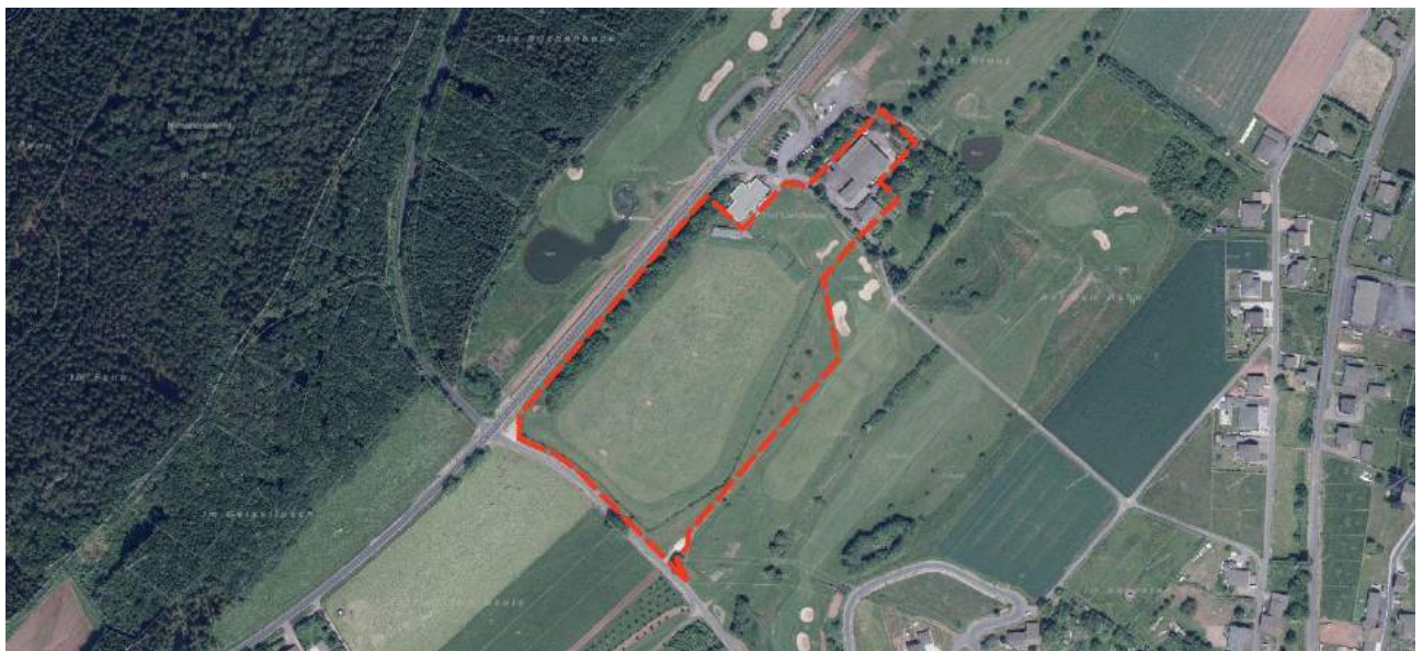
Abbildung 2: Grenzen Geltungsbereich Planänderung