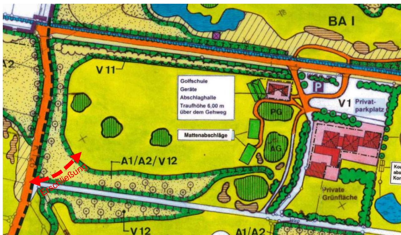
Abbildung 5: Veränderung Ausgleichsflächen (Quelle: Ausschnitt Bebauungsplan „Golfplatz Burbach“, Teilbereich | ohne Maßstab)

Im gültigen Bebauungsplan „Golfplatz Burbach“ werden Festsetzungen zur Anpflanzung von Bäumen (Maßnahme zum Schutz, zur Pflege und Entwicklung von Natur und Landschaft vgl. Grünordnerische Festsetzung; 3.7; A1/A2/V12 und V11) getroffen. Durch die geplante Änderung wird eine Änderung der Festsetzungen notwendig. Zukünftig wird unterschieden in Maßnahmen, Anpflanzverpflichtungen und Bindungsverpflichtungen. Das Konzept ist im Zuge der Ausgleichsermittlung entwickelt worden und in die Planung eingeflossen.